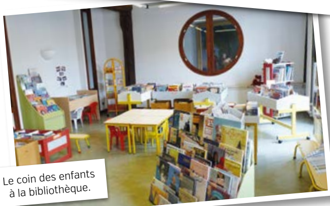
Le coin des enfants à la bibliothèque.

Ce véhicule a été acheté d'occasion, 25 000 euros, avec reprise de l'ancien, au garage Guillemaud.