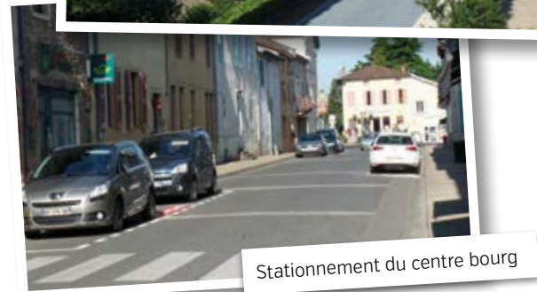
Stationnement du centre bourg