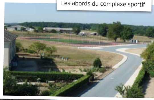
Les abords du complexe sportif