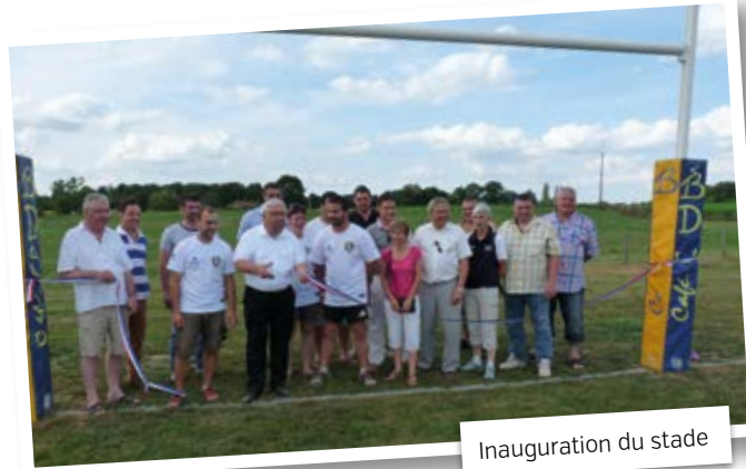
Inauguration du stade

Le 27 juin, a été inauguré le stade de rugby, contigu à celui du football. Cette inauguration était précédée par un après-midi découverte. 40 jeunes se sont pris au jeu et ont voulu « marquer l'essai ». Un bungalow a été rajouté à ceux existants, permettant la création de douches. Sur ce stade évoluera le Rugby Club de Haute-Bresse, une antenne du club de Pont-de-Vaux. Le coût des travaux budgétés s'élève à 36 500 €.