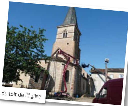
Nettoyage du toit de l'église

Le toit de l'église avait grand besoin d'un nettoyage. En effet, la mousse avait envahi les tuiles, et l'intervention d'une entreprise spécialisée a été nécessaire pour redonner une nouvelle jeunesse à cette toiture. Quelques tuiles ont également été changées. Ces travaux ont été effectués pour la somme de 9 690 € TTC.